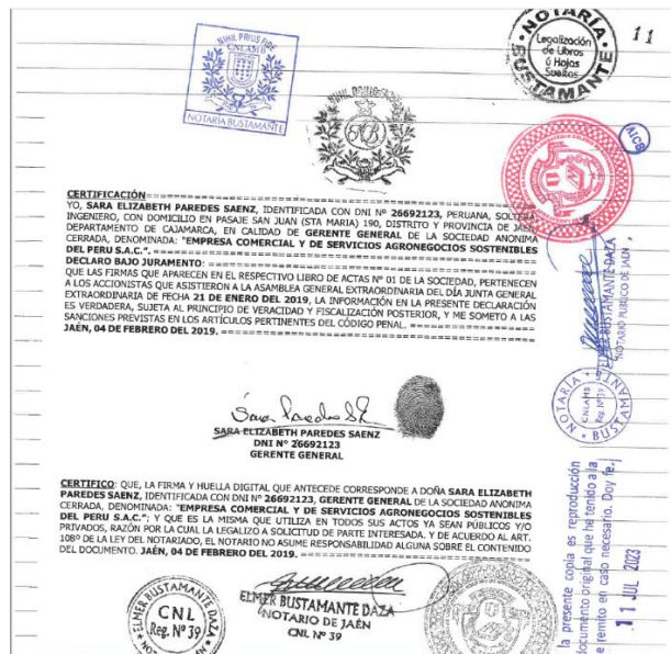
IMAGEN DEL DOCUMENTO DONDE SE OBSERVA LA CERTIFICACIÓN DE LA FIRMA DE LA GERENTE GENERAL DE FECHA 04 DE FEBRERO DE 2019